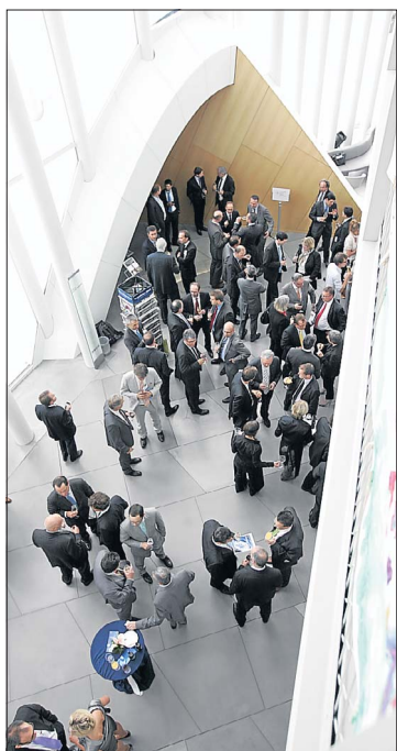
Die Philharmonie ist ein guter Rahmen für die Präsentation des LBC.

Zum fünften Mal haben die Wirtschaftsprüfungsgesellschaft KPMG und das „Luxemburger Wort“ der nationalen Wirtschaft den Puls gefühlt. Die Ergebnisse des „Luxembourg Business Compass“ (LBC) wurden am Mittwoch vor hochrangigen Vertretern der Luxemburger Ökonomie vorgestellt.