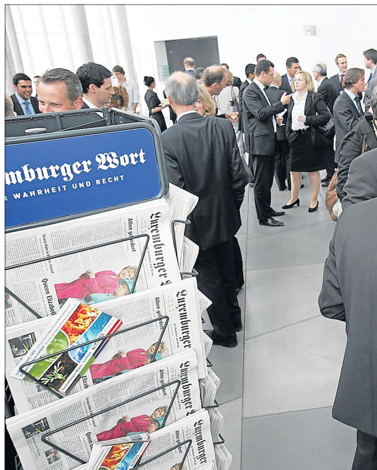
Etwa 150 Gäste – Entscheidungsträger aus Wirtschaft und Politik – waren der Einladung von KPMG und Luxemburger Wort gefolgt.