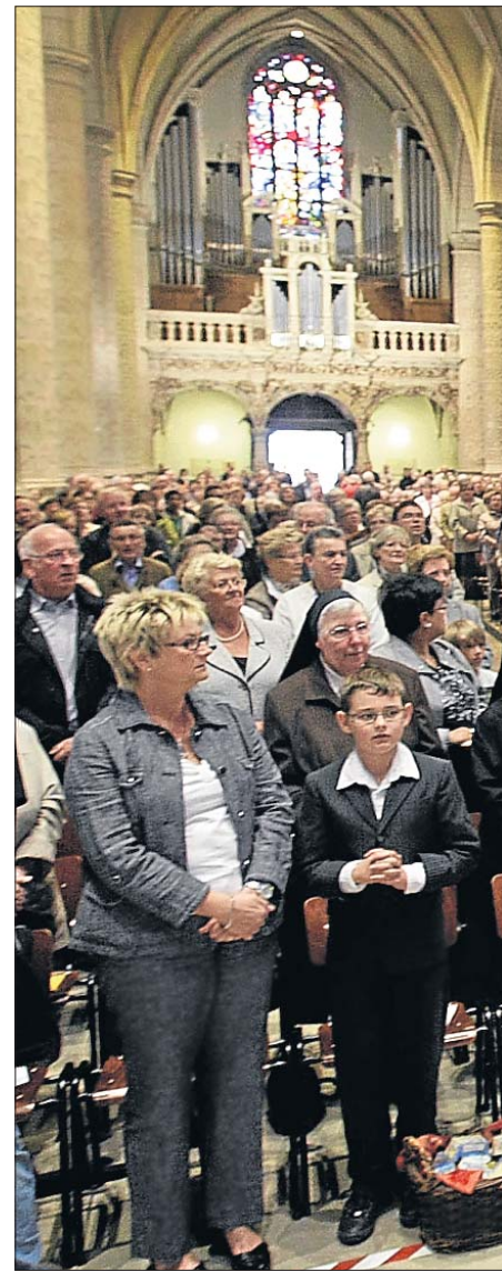
In feierlicher Prozession wurde das Gna-

„Kuck, ech sinn dem Här seng Mod, et soll mer geschéien, esou wéi s Du et gesot hues.“ Mit diesem Zitat aus dem Lukas-Evangelium bekräftigte der Erzbischof im zweiten Teil seiner Predigt das Ja-Wort Marias zu Gott: „Duerch de Jo vu Maria konnt Gott Mënsch ginn, ee vun äis ginn. A sengem Jong huet Gott Jo zu äis gesot. Dëse Jo vu Gott gëllt fir all Mënschen a fir all Zäiten. Gott ass a bleiwt permanent um Wee zum Mënsch. Dat geschitt duerch d'Kierch, där hir Aufgab et ass, d'Begëinung vu Gott mat dem Mënsch ze erméiglechen.“