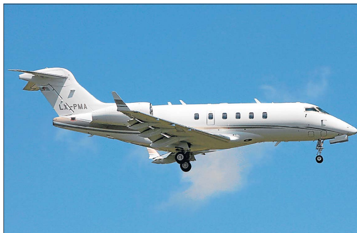
Un Bombardier Challenger 300