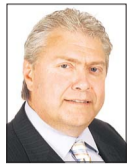
«Un juge coupable d'un excès de justice!» MARCEL KIEFFER

En Espagne il fut un temps où on tuait «comme chez nous on déboise» (Antoine de Saint-Exupéry). Ainsi que nous l'apprend l'Histoire, seule juge impartiale de notre justice temporelle, les atrocités de la Guerre civile espagnole, voici plus de 70 ans, ne furent l'exclusivité d'aucun camp. Elles souillèrent les combats et les idéaux à la fois des franquistes et des républicains. Etrangement, l'Espagne moderne, démocratique, issue du pire cataclysme qu'une nation puisse subir, ne s'est toujours pas affranchie des démons de son terrible passé. Les déboires du juge Baltasar Garzon, justicier applaudi et courageux de la cause d'une justice universelle, illustrent à quel point cette ligne de partage qui jadis opposa les Espagnols en frères ennemis, subsiste telle une plaie toujours saignante dans l'âme collective des générations contemporaines espagnoles.